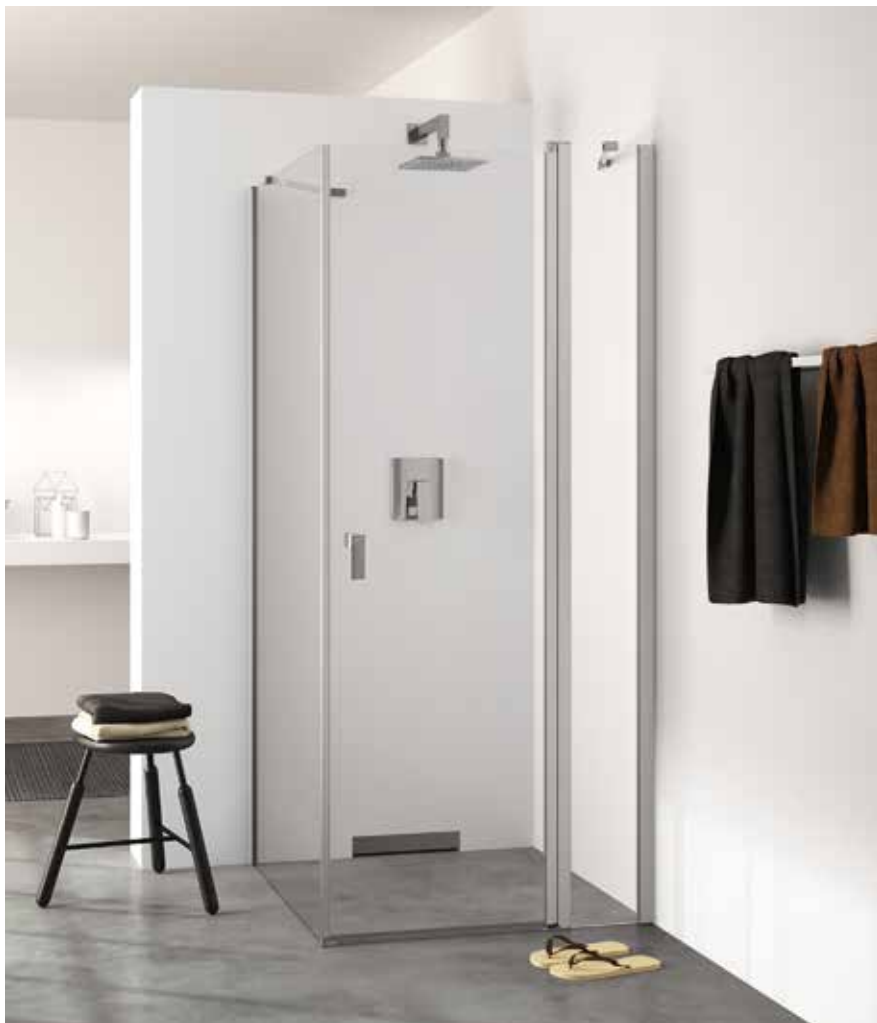
Křídlové dveře s pevným segmentem a boční stěnou