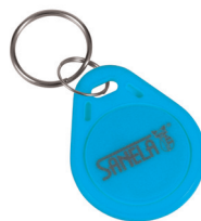
1 ks ze sady 50 ks žetonů SLZA 51B