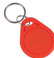
1 ks ze sady 50 ks žetonů SLZA 51R