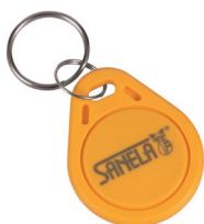
1 ks ze sady 50 ks žetonů SLZA 51